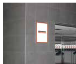
Лайтбоксы в общественных зонах 13 605 ₽, 0,6x0,4 м, один лайтбокс