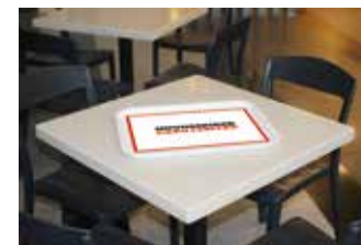
Подложка на подносы в кафе 50 000 ₽, 0,3x0,37 м, 3 000 шт