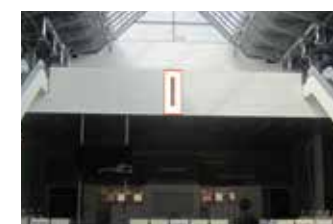
Флаги на перилах балкона 3 этажа над кафе 16 244 ₽, 3,5x1,5 м, один флаг