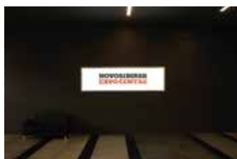
Лайтбокс на стене холла 1 этажа 28 820 ₽, 0,81x2,93 м, один лайтбокс