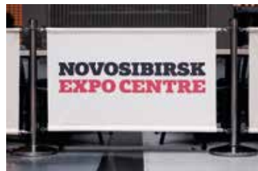
Ограждения перед кафе 11 850 ₽, 0,8x1,25 м, одно ограждение