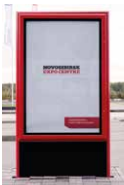
Лайтбокс на аллее 15 869 ₽, 1,8x1,2 м, один лайтбокс