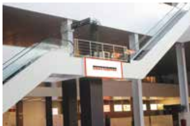
Лайтбокс на боковой площадке эскалатора 27 750 ₽, 0,81x2,93 м, один лайтбокс