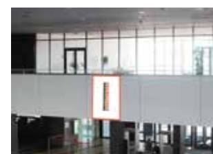
Флаги на перилах балкона 2 этажа 8 505 ₽, 2,1x1,5 м, один флаг